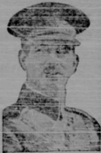
M. S. REGELE CAROL II Președintele Activ al Ligii Navale Române

„Mircea a format primii noștri marinari”. Pe puntea și în arborada lui, s'a format personalul național, dela comandant până la marinari, creștând apoi școala „MIRCEA”, care dăinuiește și va dăinui, a spus M. S. Regele Carol II-lea. El însuși admirator al Mării și vădnic cunosător al marinei,